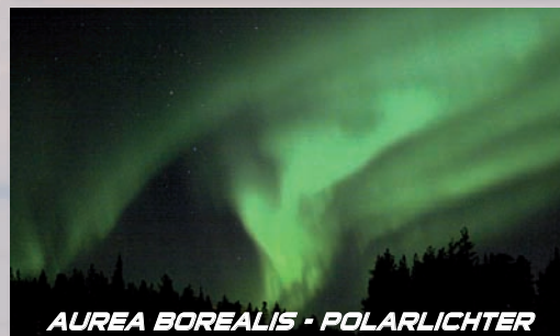
AUREA BOREALIS · POLARLICHTER