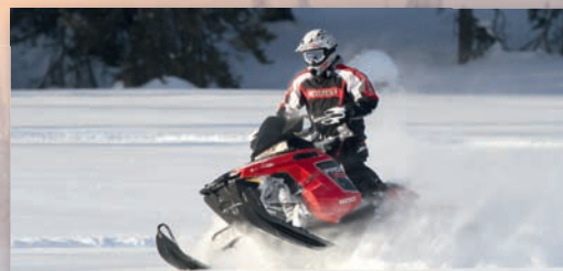
snowmobile outdoor adventures · Snowmobile Guide