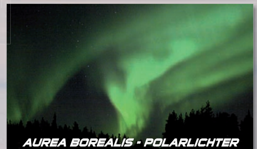
AUREA BOREALIS - POLARLICHTER