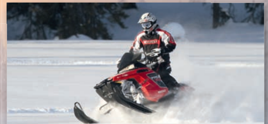
snowmobile outdoor adventures · Snowmobile Guide

Download Anmeldeformular: www.supertour.de/download/hitradiiohr.pdf