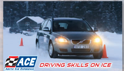
ACE ARCTIC CAR EXPERIENCE DRIVING SKILLS ON ICE